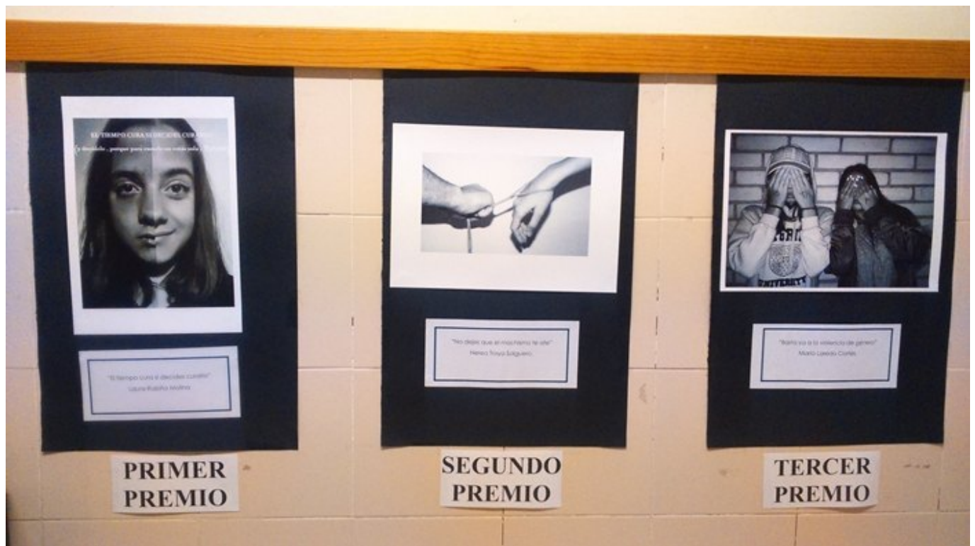
VI Concurso de fotografía digital contra la violencia de género