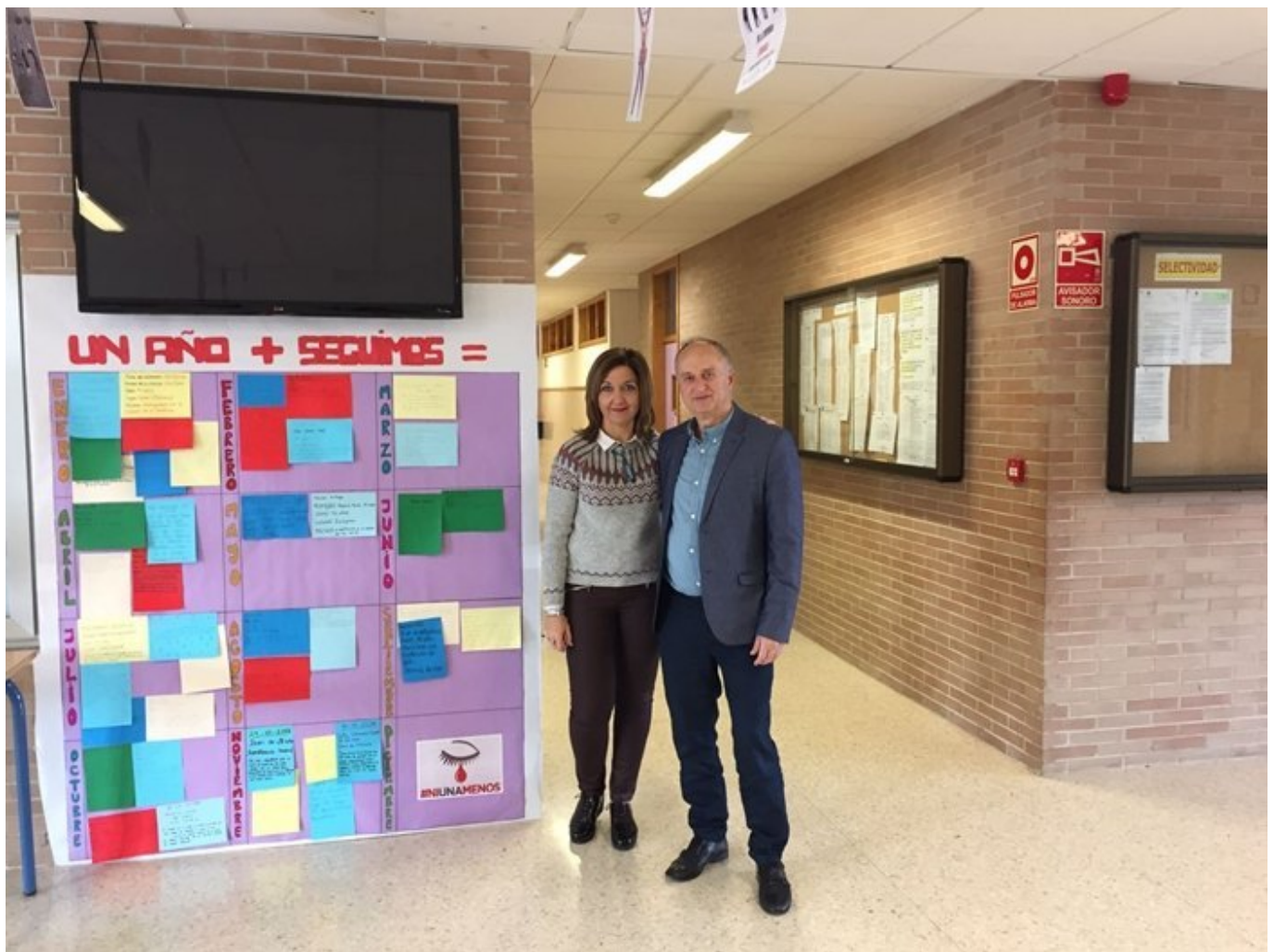
25 de Noviembre: “Día de la no violencia de género”