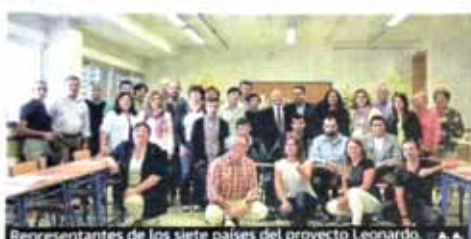
Representantes de los siete países del proyecto Leonardo.