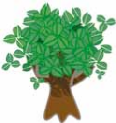
Programa "Crece con tu árbol"