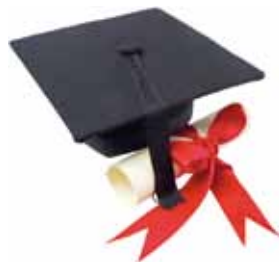
Prácticum Máster Secundaria