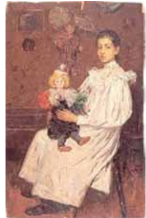
La niña y su muñeca. Pintado a la temprana edad de 14 años.