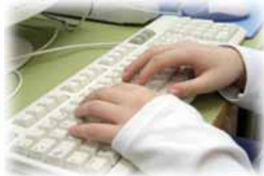
Escuela TIC 2.0