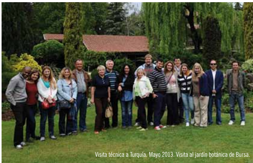
Visita técnica a Turquía. Mayo 2013. Visita al jardín botánica de Bursa.