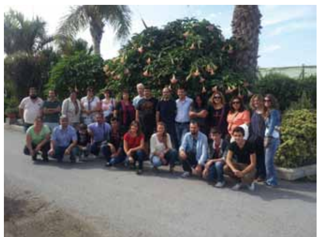
Todos los representantes de los países miembros del proyecto Euroflora visitan Viveros Reina en Motril, especializado en el transporte internacional de plantas ornamentales. Se llevó a cabo una visita explicativa por todas las instalaciones de la mano de sus propietarios.