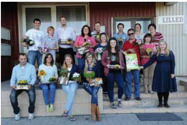
Visita técnica a Estonia. Agosto 2013. Taller teórico-práctico sobre composiciones y arreglos florales.