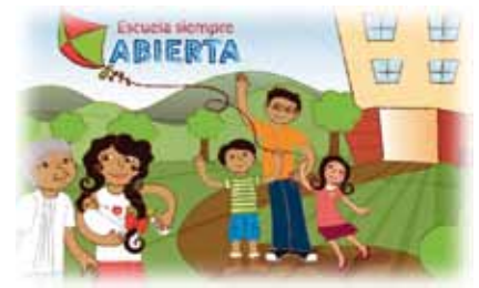
Plan de Apertura de Centros Docentes