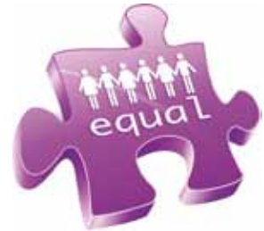
Plan de Igualdad entre hombres y mujeres