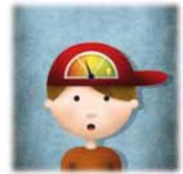
Programa de Calidad y Mejora de Rendimientos Escolares