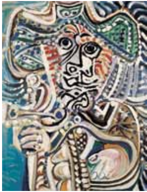
Mosquetero con espada: una mezcla de colores muy inusual.

La visita fue sin duda increíble. Los cuadros que más me llamaron la atención fueron: