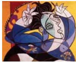
Mujer con brazos levantados, de colores muy llamativos. Óleo, carboncillo y arena.