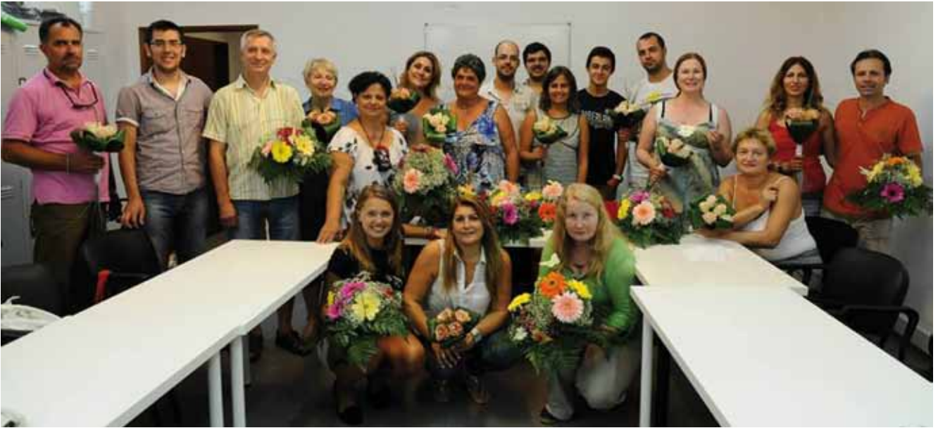
Visita técnica a Portugal. Septiembre 2013. Taller teórico-práctico sobre composiciones y arreglos florales más populares en Portugal.