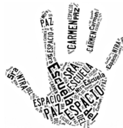
Red Andaluza Escuela "Espacio de Paz"