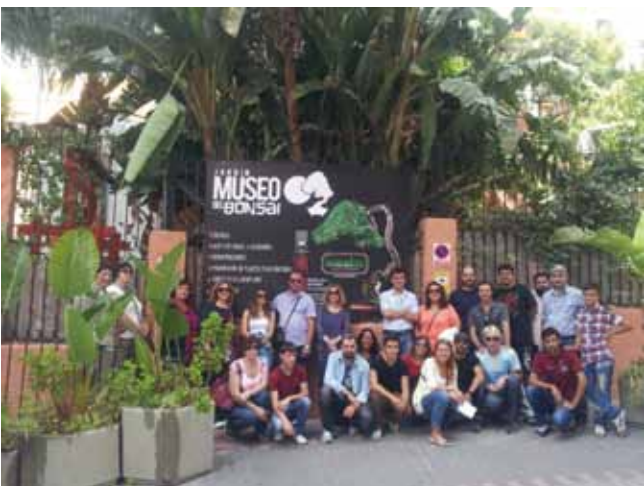
Visita técnica al Jardín-Museo del Bonsai en Almuñécar que, con sus más de 200 ejemplares expuestos, está considerado el más importante de Andalucía y uno de los mejores de España.