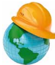
Plan de Salud Laboral y PRL