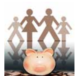
Educación Económica y Financiera