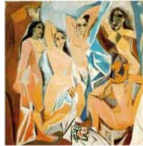
Me gustó mucho su traje de bautizo y también sus bocetos realizados para el lienzo que posteriormente realizaría: Las señoritas de Aviñón .