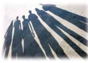
Programa de Acompañamiento Escolar