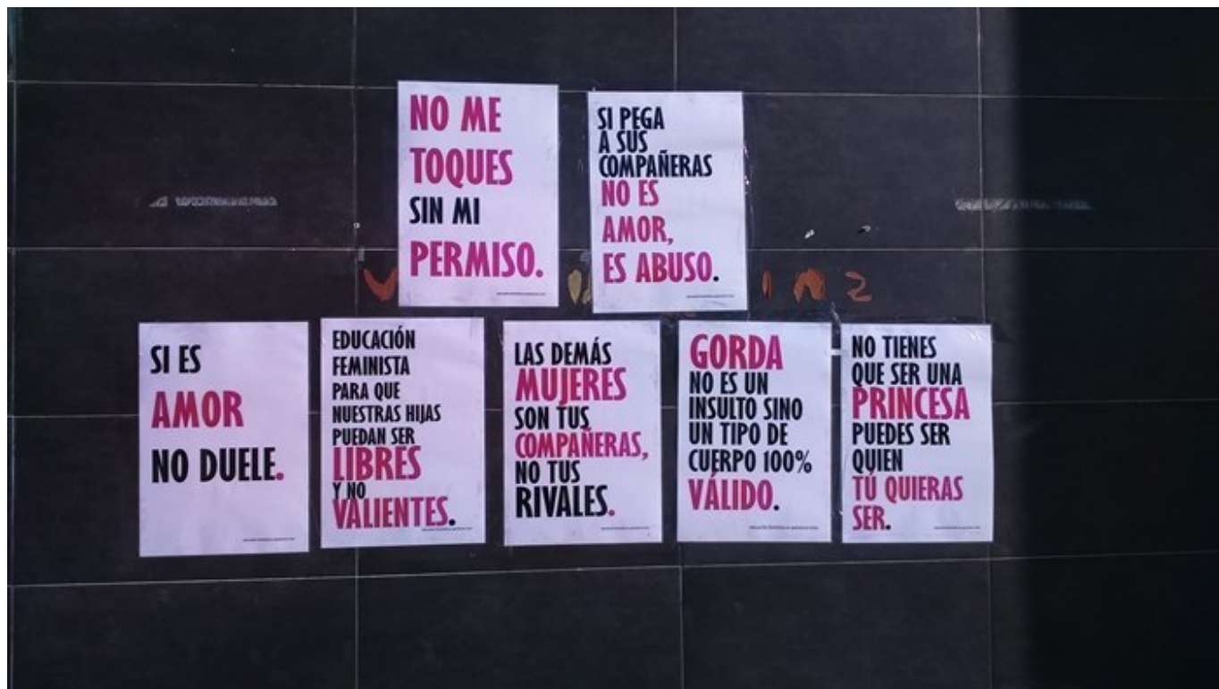
Campaña feminista llevada a cabo por el alumnado de Bachillerato

25 de Noviembre: "Día de la no violencia de género"