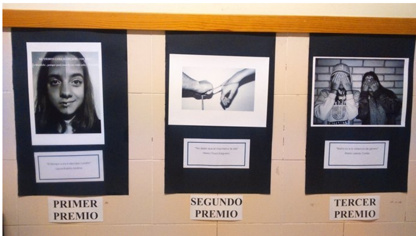
VI Concurso de fotografía digital contra la violencia de género