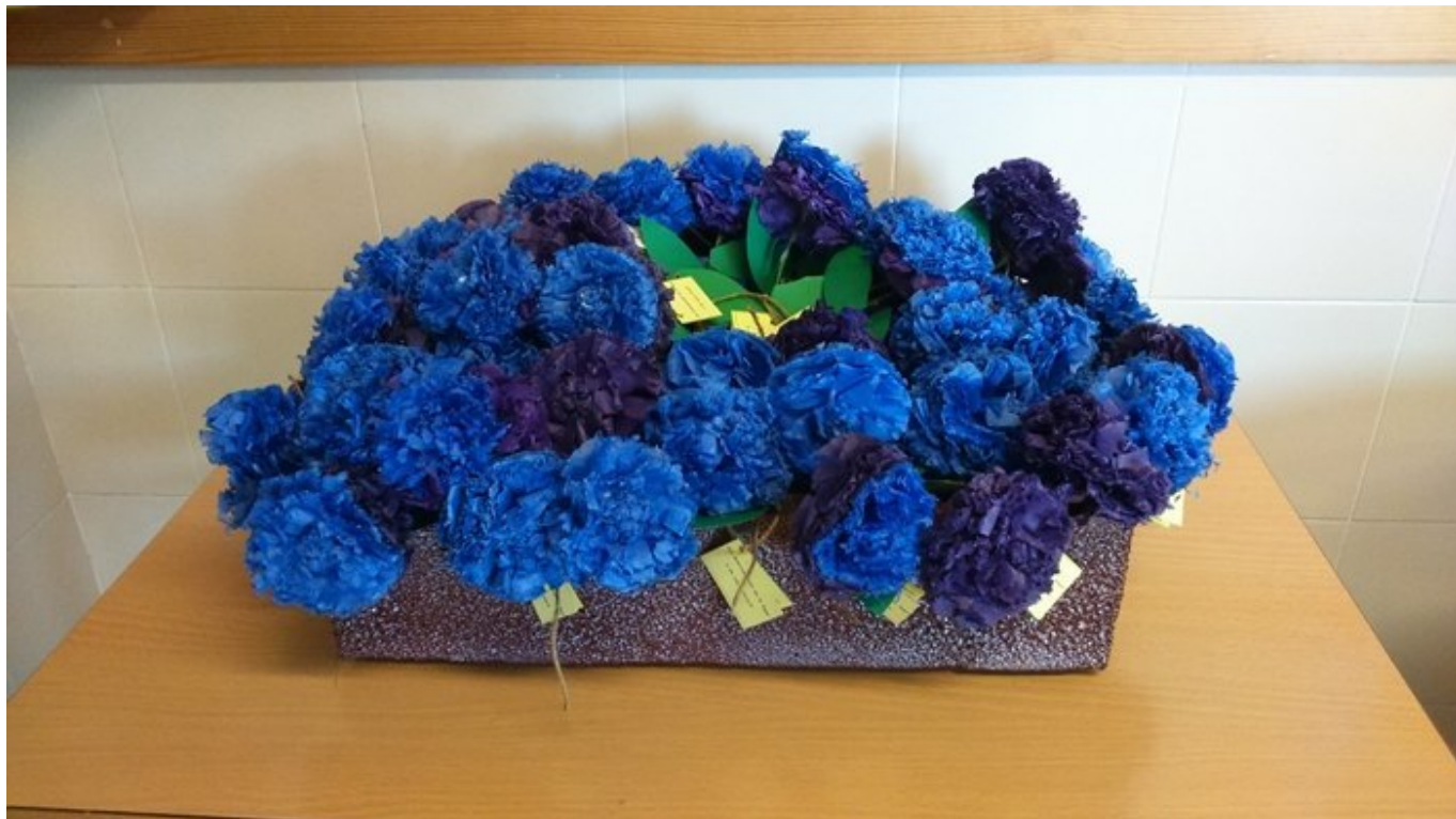
“Aromas de Igualdad” 8 de Marzo. Día Internacional de la Mujer