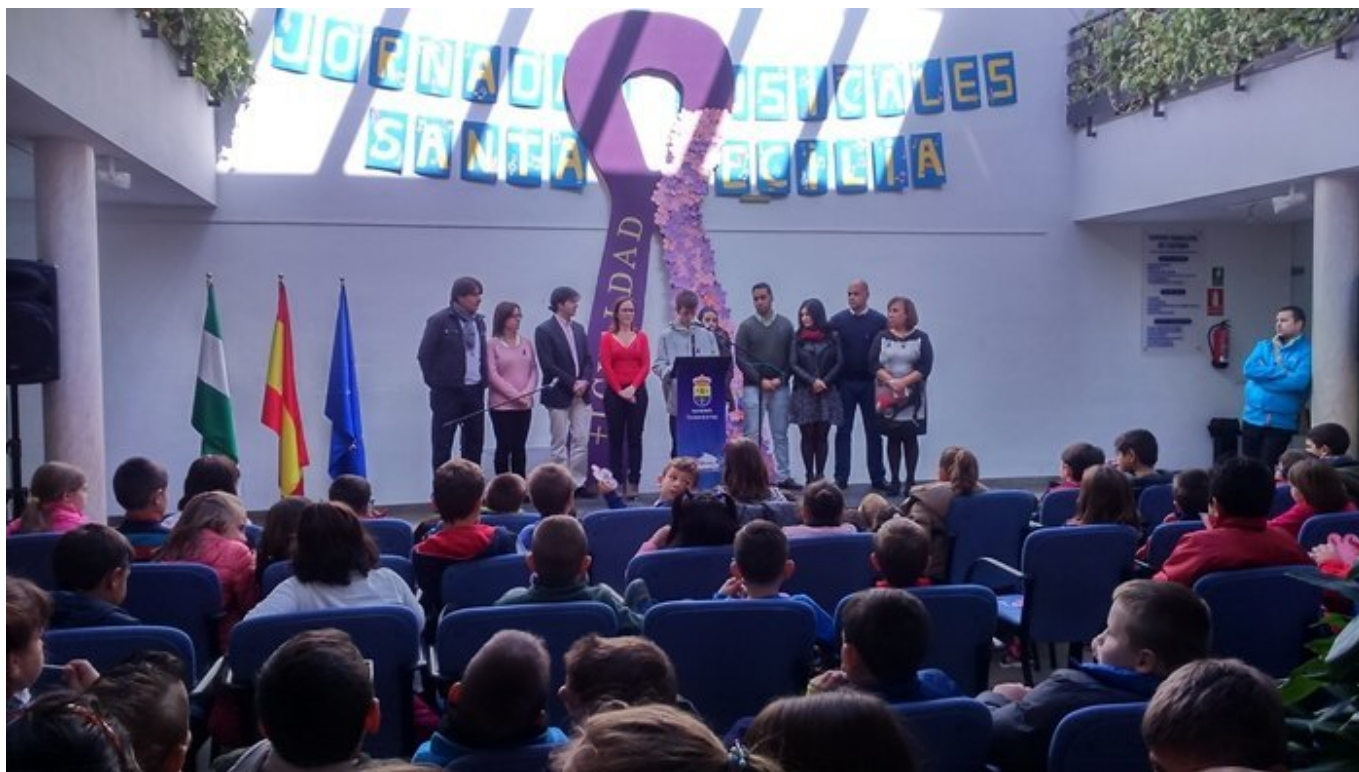
Actividades contra la violencia de género con el Ayuntamiento de Churrana