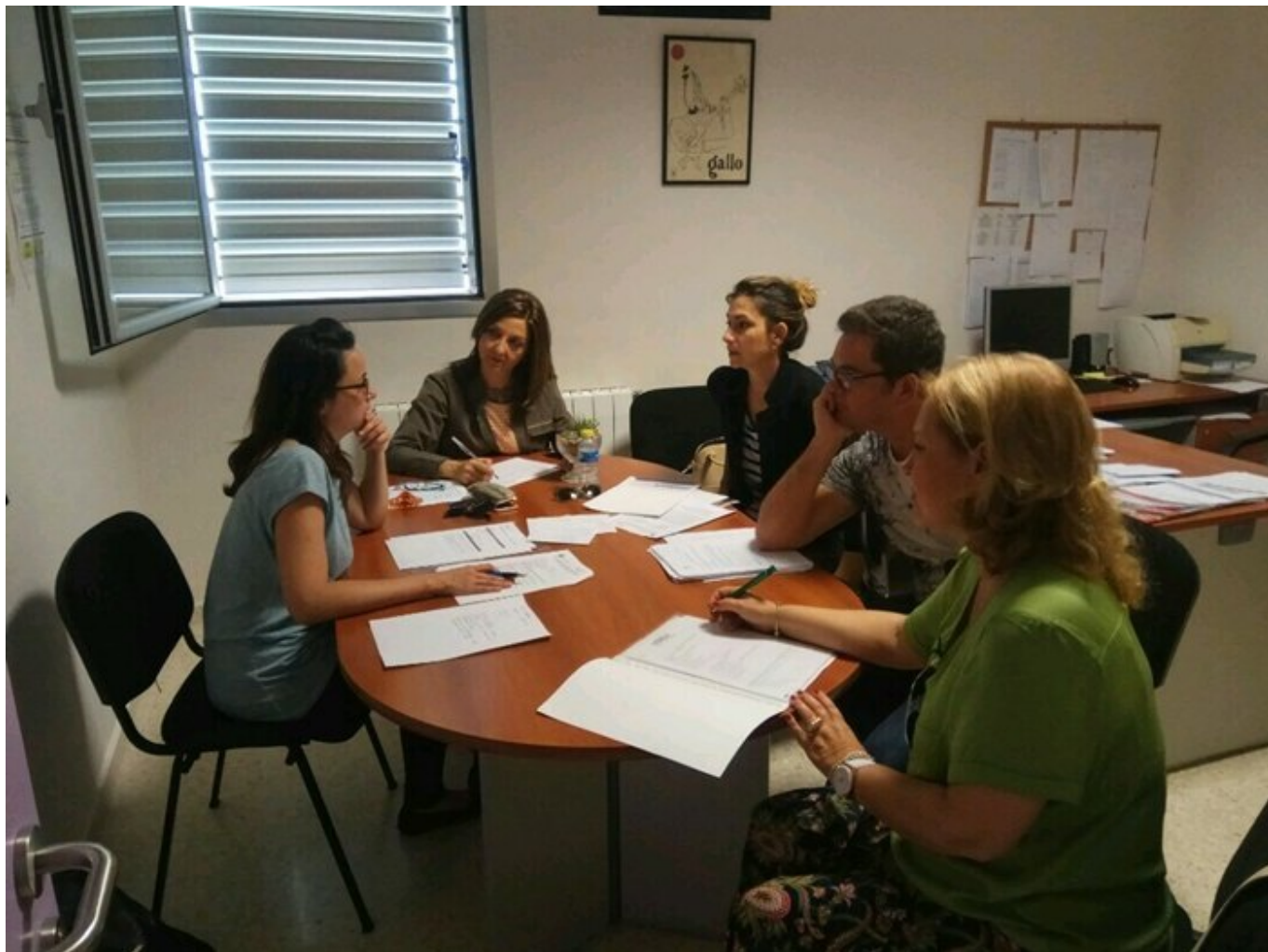
Coordinación con Medicus mundi para proyectos comunes