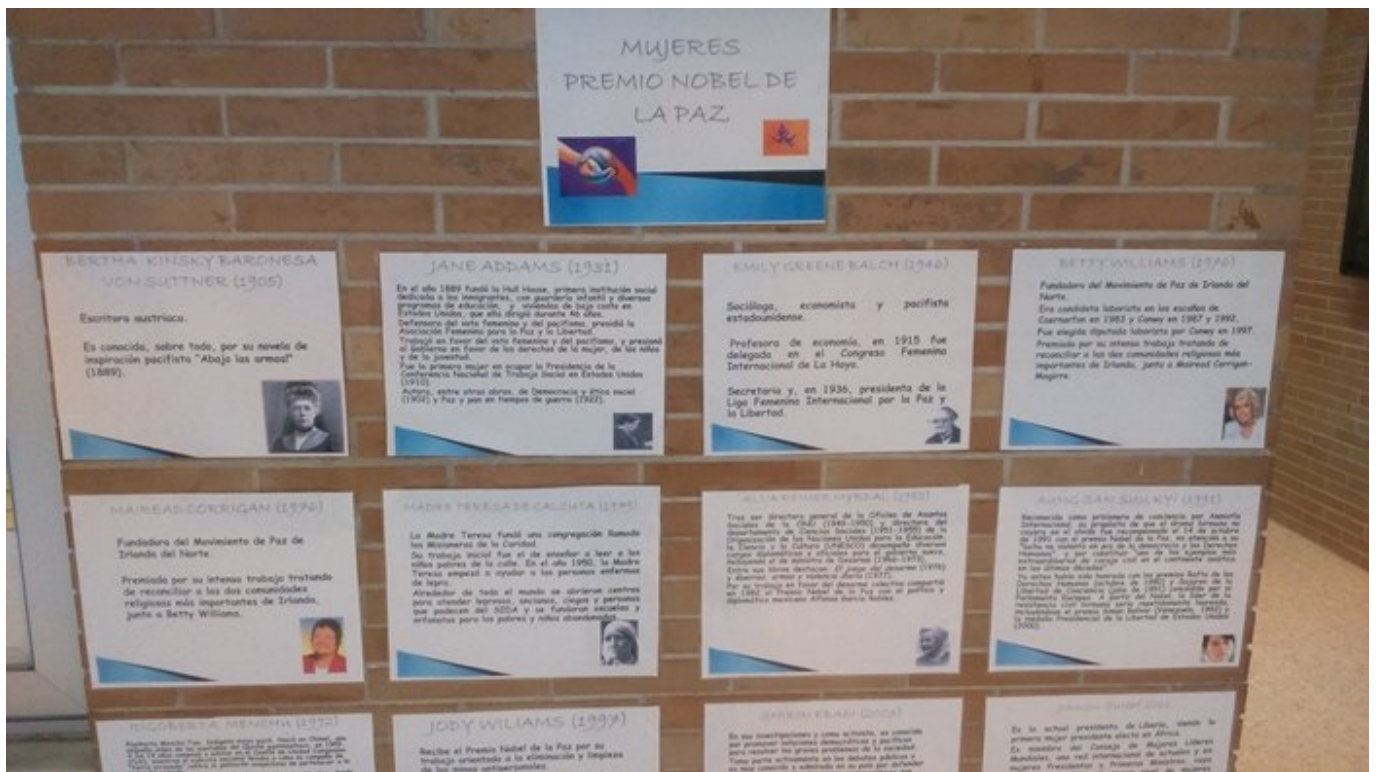
Exposición "Mujeres Premio Nobel de la Paz" Día de la Paz